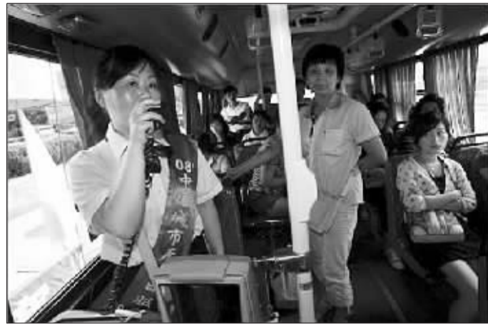
925路参加“迎世博”优质服务展示的乘务员提醒乘客。

周顺国还对早报的这次“挑刺”报道表示感谢,并欢迎媒体和市民、游客提出更多的意见和建议。