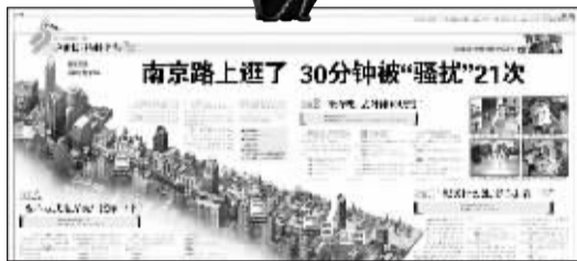
早报9月23日相关报道版面。